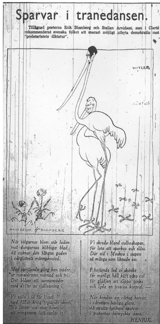
Bild 1: Karikatyren "Sparvar i tranedansen" ur Dagens Nyheter 31 mars 1933

en artikel i Greifswalder Universitäts-Zeitung , i vilken man inte bara tog på sig äran för Arvidsons avskedande, utan även krävde, som man uttryckte det, en