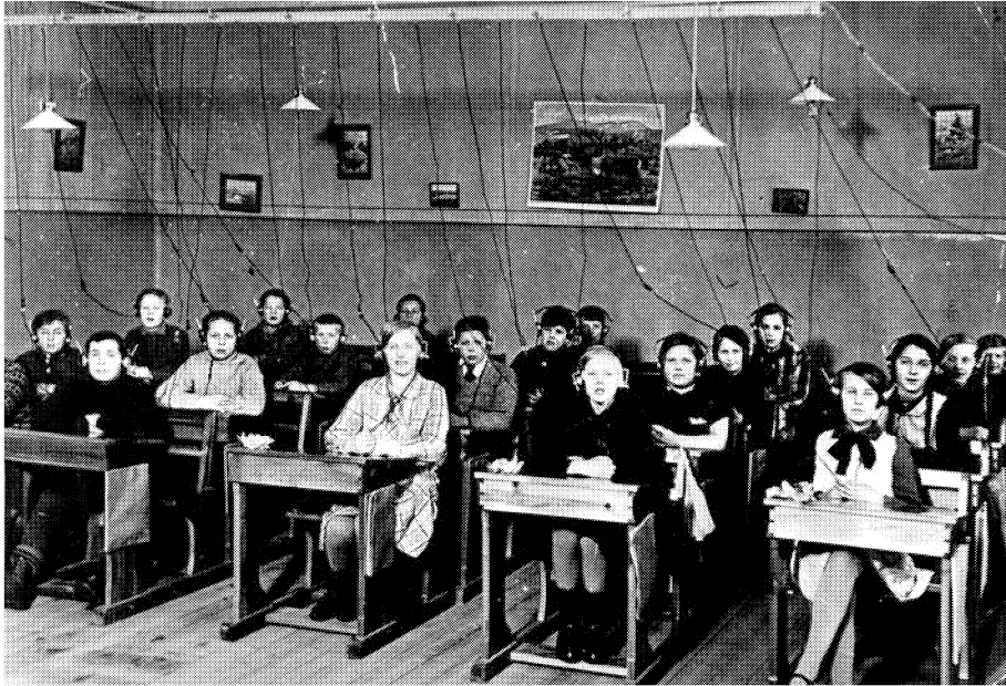
Bild 1. Försök med radio i undervisningen på 1930-talet

nedan. Men man bör kanske göra sig påmind om vikten av att experimentera för att få ökad kunskap och erfarenhet om möjligheter med ny teknik.