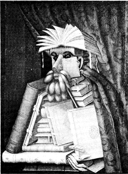
"Bibliotekarien" Guisepe Arcimboldo 1500-tal. Omslagsbild: ur planschhäftet "Mina bokstäver" 1966