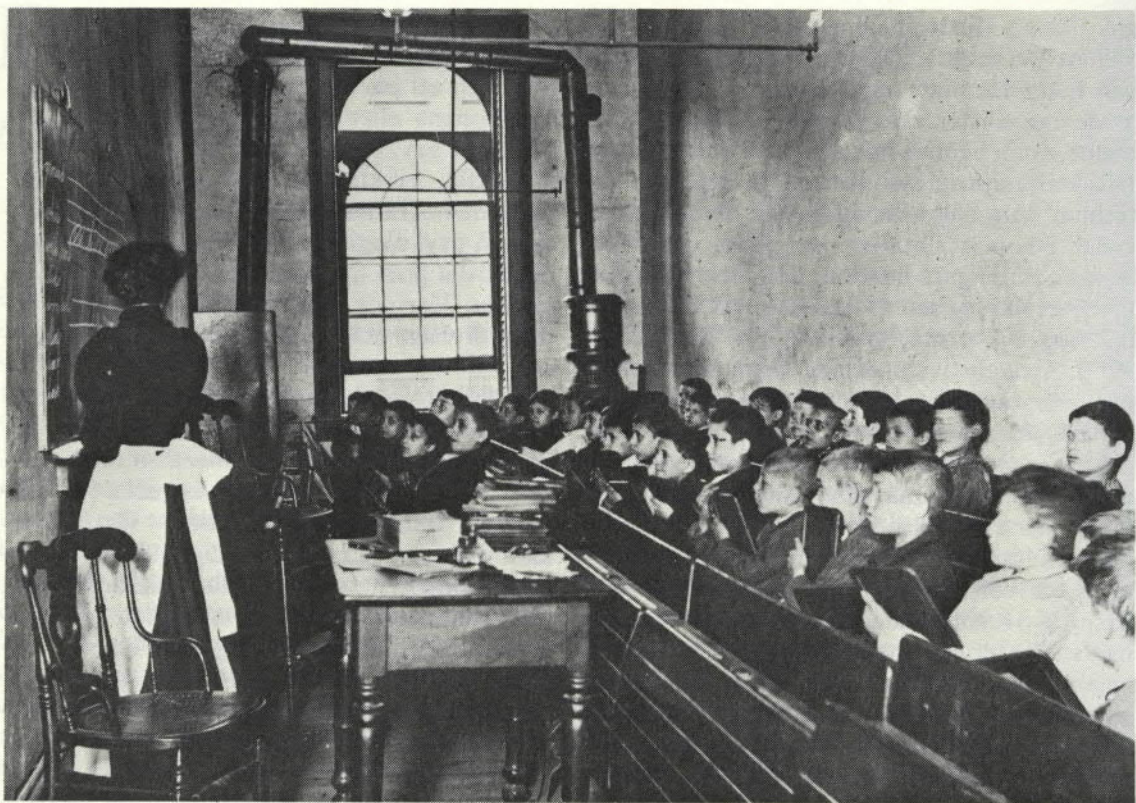
FREE SCHOOLING, available to all, helped these immigrant children of the 1880's become productive citizens of the United States.

Amerikanska barn i invandrarstadsdel i 80-talets New York.