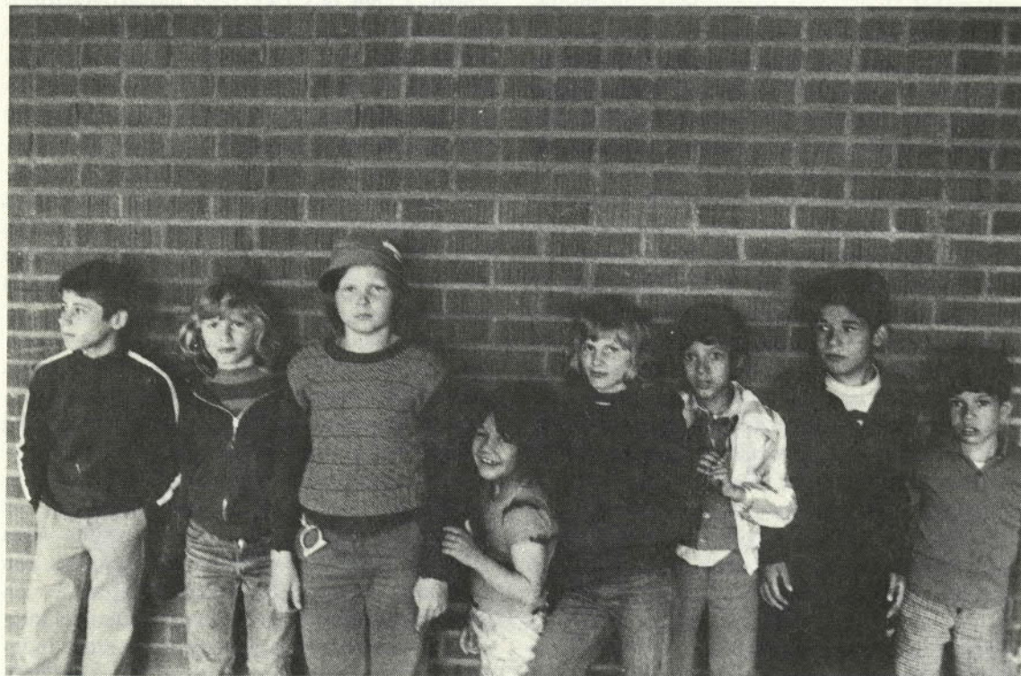
Svenska barn i invandrarstadsdel: 70-talets Stockholm.

Man kan gå längre tillbaka i tiden och sätta de svenska socialdemokraternas »nya« skola i samband med förändrade arbetskraftskrav och den från och med 30-tallet accelererande inflytningen från landsbygden till städerna (ännu