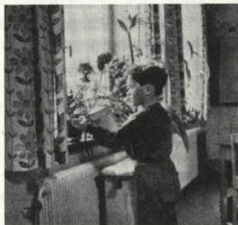
Att plantera och vårda krukväxter, att ta emot besökande i klassrummet och att biträda läraren vid enklare rutinarbeten ger barnen en känsla av att utöva något av rikt och att ha lärarens förtroende.

skilt principen om deltagarstyrning ställde till problem, eftersom den tolkades som ett påbud om elevstyrning. Läraren skulle vara »medstuderande« eller hålla sig i bakgrunden. Och projekten fastnade i personkonflikter och kontroverser kring arbetsformerna. Efter hand insåg man att projektorganiserad undervisning kräver noggrann planering och genomtänkt styrning, och framför allt att undervisningsformer aldrig får bli självändamål, utan måste ha någon slags relation till deltagarnas bakgrund och intressen, och studiernas innehåll måste ha politisk relevans. Organisationen »Arbetsgruppen för en progressiv folkhögskola«, som ägnat de pedagogiska metodfrågorna stort intresse, självdog. Den nybildade »Arbetsgruppen för en folkets högskola« har bl a ordnat konferenser om arbetslösheten. Många folkhögskollärare har gjort upp med metodfixeringen och satsar t ex på att folkhögskolorna ska fungera som regionala centra.